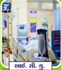
આઈ. સી. યુ.