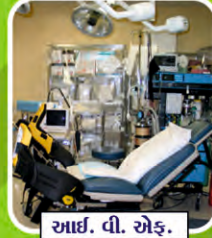
આઈ. વી. એફ.