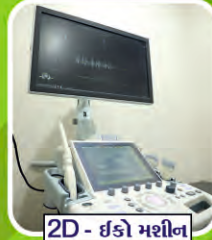
2D - ઇકો મશીન